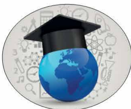
Master di I e II livello