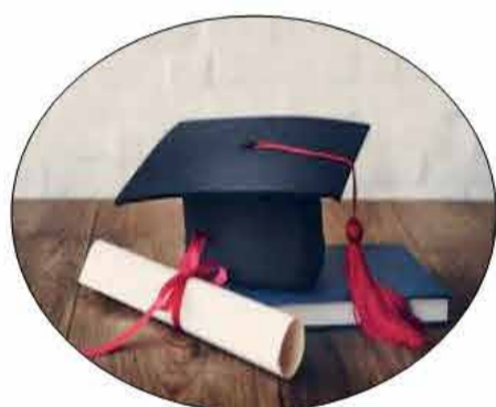
10 Corsi di Laurea