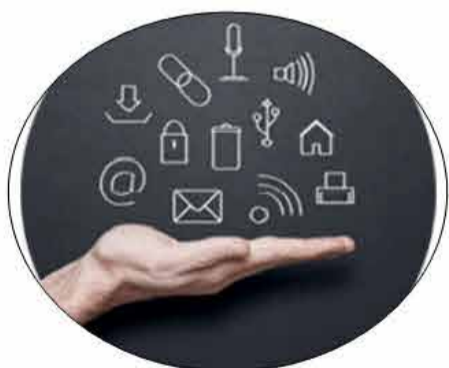
Certificazione Informatica EIPASS