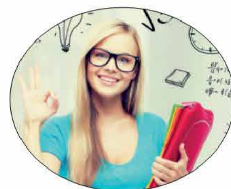
Recupero anni scolastici