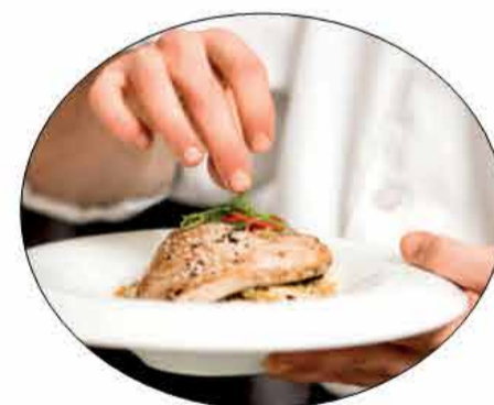
Corsi Professionali di Alta Ristorazione